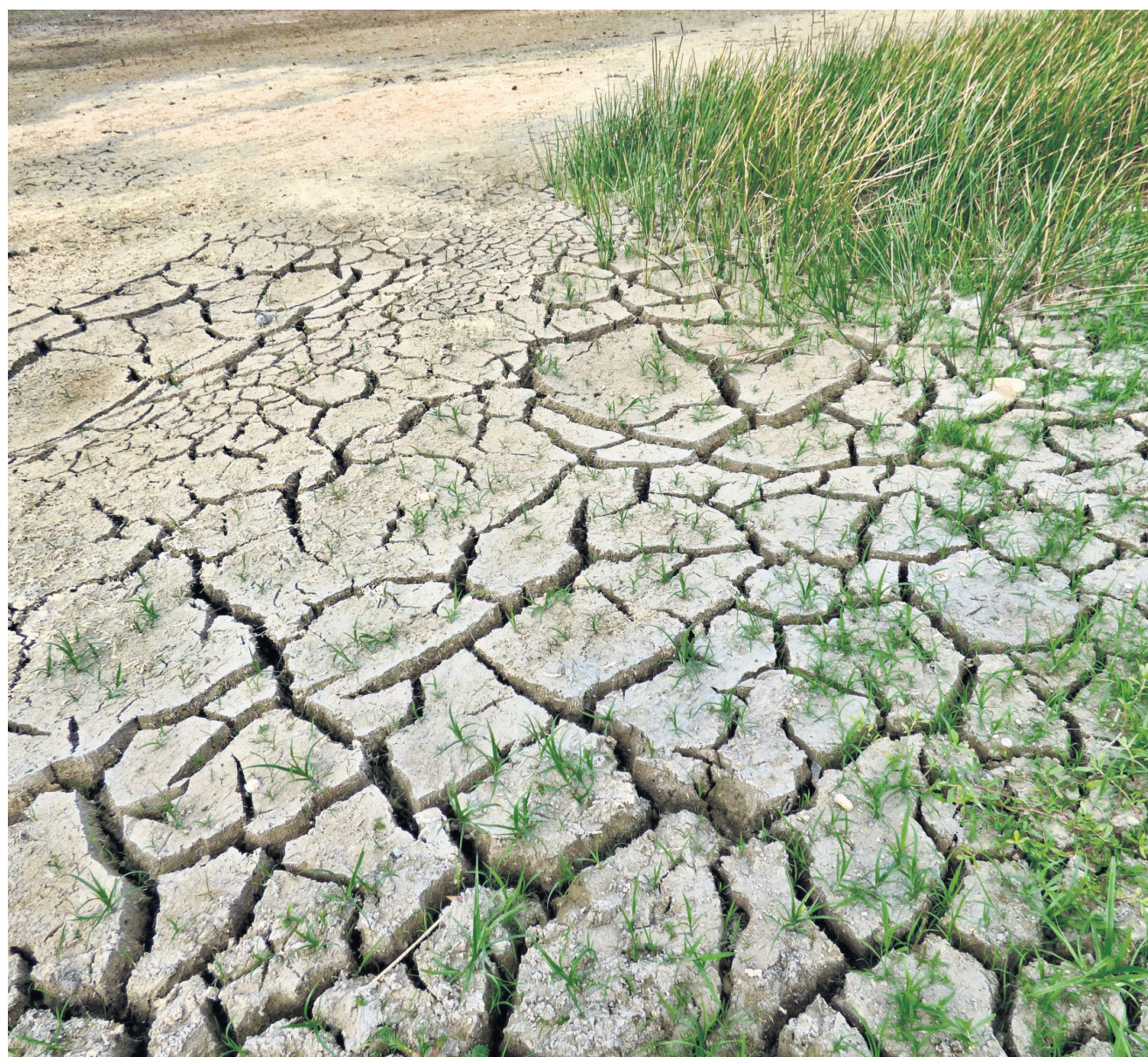
Klimaschutz wird in den nächsten Jahren das dominante Thema im Philanthropiesektor.