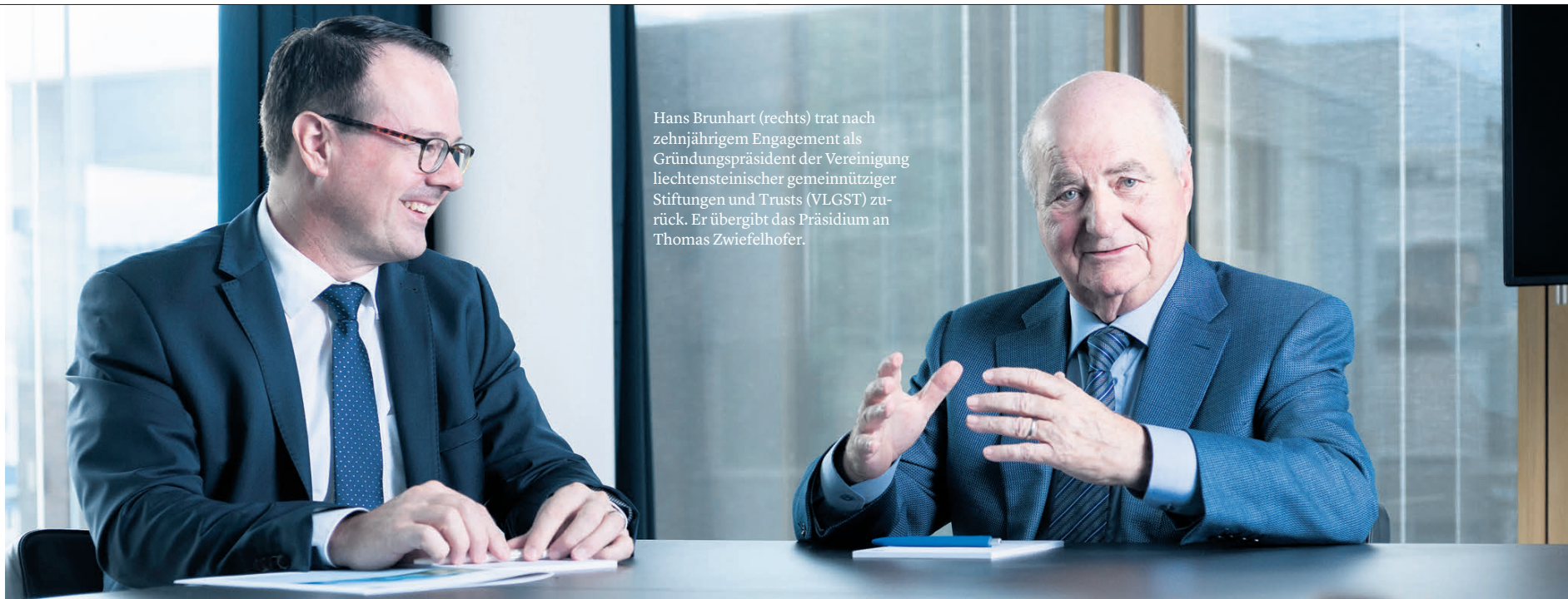
Hans Brunhart (rechts) trat nach zehnjährigem Engagement als Gründungspräsident der Vereinigung liechtensteinischer gemeinnütziger Stiftungen und Trusts (VLGST) zurück. Er übergibt das Präsidium an Thomas Zwiefelhofer.