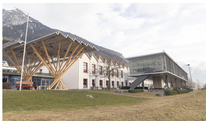
Das Center für Philanthropie der Universität Liechtenstein lieferte die Daten für die internationale Studie.

Die Studie begründet die Pole-Position wie folgt: «Liechtenstein hat äusserst förderliche regulatorische, politische, wirtschaftliche und soziokulturelle Rahmenbedingungen für die Philanthropie. Liechtenstein erlaubt Steuerabzüge für die