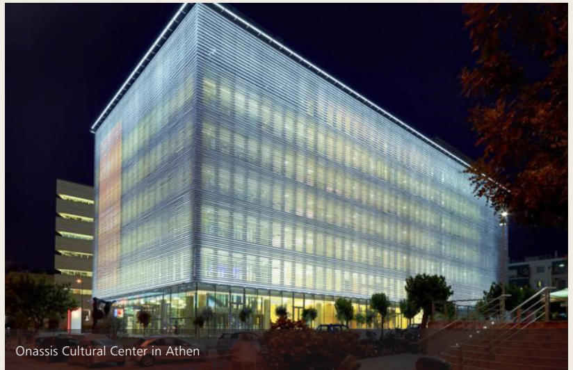
Onassis Cultural Center in Athen

Leitprojekte | Wichtigstes Projekt zur Förderung der griechischen Kultur ist die Errichtung und der Betrieb des Onassis Cultural Center in Athen. Die klassische griechische Kultur wird durch die Errichtung der Onassis Bibliothek im Metropolitan Museum in New York gefördert. Zudem erfolgt die Finanzierung zahlreicher Institutionen, die auf dem Gebiet der klassischen Sprachen, Philosophie und Archäologie tätig sind. Im humanitären Bereich sticht das Onassis Cardiac Center in Athen heraus, eine hochmoderne Klinik für Herzkrankheiten. Wirkung | Jährlich vergibt die Onassis Stiftung über 100 Stipendien an graduierte griechische Studenten. Weiterhin entsendet die Stiftung bis zu 15 hoch begabte junge Wissenschaftler zum jährlichen Treffen der Nobelpreisträger in Lindau. Jedes Jahr wird ein einwöchiger Kurs an der Universität von Kreta finanziert, an dem abwechselnd die weltweit führenden Wissenschaftler aus Physik, Chemie, Biologie und Computerwissenschaften zu Vorlesungen eingeladen werden. Bis zu 40 Stipendien werden jährlich an ausländische Wissenschaftler vergeben, die in Griechenland spezielle Forschungsprojekte verfolgen. Sprachkurse in Alt- und Neugriechisch an Universitäten in Europa und Nordamerika werden ebenso finanziert.