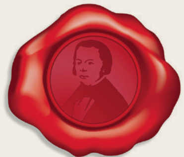
Gedächtnisstiftung Peter Kaiser 1793 – 1864

Entstehung | Peter Kaiser (1793-1864) gehört zu den herausragenden Persönlichkeiten der Geschichte des Fürstentums Liechtenstein. In Anerkennung seiner bleibenden Verdienste, die er sich als Pädagoge, Historiker und Politiker erworben hat, wurde im Jahre 1985 die gemeinnützige Stiftung errichtet, die seinen Namen trägt. Zweck und Ziele | Die Stiftung hat sich zum Ziel gesetzt, mit ihrer Fördertätigkeit zur Mehrung des Ansehens Liechtensteins in der Welt beizutragen. Als zweckbestimmender Auftrag wird der Erhalt und die Stärkung unserer christlich-abendländischen Kultur festgehalten. Die Stiftung sieht sich der Würde des Menschen verpflichtet und den daraus ableitbaren Aufgaben zum Wohle der Gemeinschaft. Leitprojekte | Diesem Selbstverständnis entsprechend unterstützt und fördert die Stiftung Einrichtungen und Bestrebungen, die sich humanitären, sozialen und karitativen Anliegen widmen. Vor diesem Hintergrund fördert sie u.a. die Restaurierung von kulturhistorisch wertvollen sakralen Bauwerken und bedeutenden Kulturgütern. Außerdem fördert sie herausragende Projekte der universitären Forschung in den Disziplinen der Geistes-