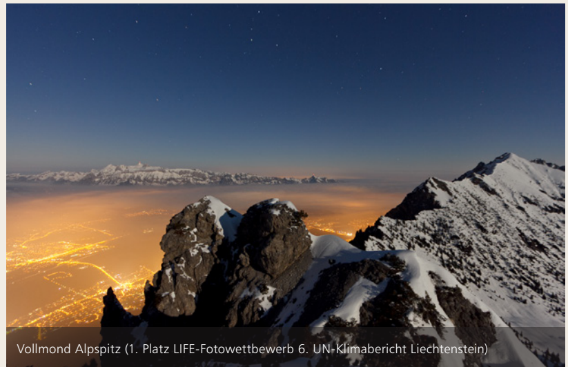
Vollmond Alpspitz (1. Platz LIFE-Fotowettbewerb 6. UN-Klimabericht Liechtenstein)