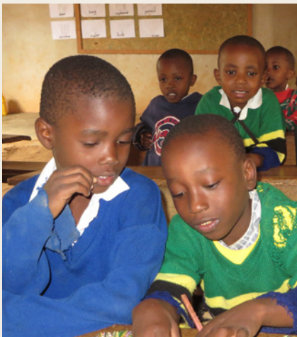
Tansania: Beim anschaulichen Unterricht sind die Schüler aktiv in den Lernprozess einbezogen

Angewandte Forschung zur Behandlung und Linderung vernachlässigter Krankheiten. Wirkung | Unsere Partnerorganisationen legen Rechenschaft über die Verwendung der zugesprochenen Mittel ab und berichten über die Wirkung der Projektintervention. Die Medicor Foundation fördert pro Jahr gut 80 Projekte. Diese werden von unseren Projektverantwortlichen in ihrer Umsetzung begleitet und auf Erreichung der vereinbarten Ziele eingeschätzt. Durch Besuche vor Ort lassen wir uns zusätzlich von der Qualität und Wirksamkeit der unterstützten Projekte überzeugen.