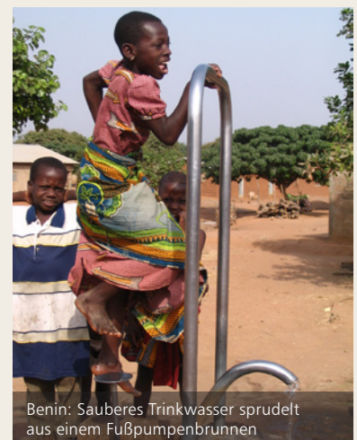
Benin: Sauberes Trinkwasser sprudelt aus einem Fußpumpenbrunnen

Entstehung | Die gemeinnützige Medicor Foundation wurde 1995 durch eine großzügige private Initiative gegründet. Zweck und Ziele | Die Stiftung soll einen wesentlichen Beitrag leisten, die Lebensbedingungen bedürftiger und benachteiligter Menschen langfristig zu verbessern. Um diesen Zweck zu erfüllen, unterstützt sie ausgewählte Projekte in Afrika, Lateinamerika, der Karibik sowie Osteuropa. Leitprojekte | Die Medicor Foundation implementiert selber keine Projekte, sondern arbeitet mit international oder national tätigen Organisationen und Institutionen zusammen. Bildung: Förderung der frühkindlichen Entwicklung sowie des Zugangs zu einem qualitativ guten Primar- und Sekundarschulbildungsangebot; berufliche Bildungsprogramme, die den Einstieg ins Erwerbsleben ermöglichen; Förderung unternehmerischer Tätigkeiten. Gesundheit: Zugang zu gesunder Ernährung, sauberem Trinkwasser sowie zu sanitären Anlagen; Verbesserung der medizinischen Grundversorgung. Soziale Hilfe: Hilfe für Betagte; Schutz- und Unterstützungsmaßnahmen für Jugendliche und von Gewalt betroffene Kinder und Frauen; gesellschaftliche Inklusion von Menschen mit Behinderungen. Katastrophenhilfe: Soforthilfe bei Naturkatastrophen oder kriegerischen Auseinandersetzungen. Forschung: