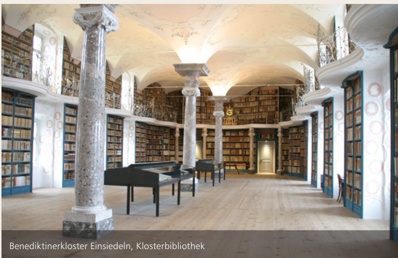
Benediktinerkloster Einsiedeln, Klosterbibliothek

Name: Gedächtnisstiftung Peter Kaiser (1793-1864) Gründung: 1985 Rechtsform: Gemeinnützige Stiftung Sitz: Vaduz Kontakt: Aulestrasse 74 9490 Vaduz info@peter-kaiser-stiftung.li www.peter-kaiser-stiftung.li