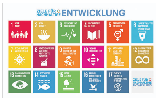
Die 17 UNO-Nachhaltigkeitsziele. (Illustration: UNO)

Zur Umsetzung und Finanzierung der SDGs spielen die gemeinnützigen Stiftungen eine wichtige Rolle. Denn sie fördern soziale und umweltbezogene Projekte sowohl in Entwicklungsländern wie auch in Industriestaaten, darunter in Liechtenstein. Um die SDGs zu erreichen, ist zusätzlich das nachhaltige Investieren massgeblich. Die Art und Weise, wie Stiftungen und andere institutionelle Investoren ihr Vermögen anlegen, hat eine mindestens ebenso grosse Hebelwirkung wie die Finanzierung von Projekten. Die verwalteten Vermögen von institutionellen Investoren liegen gemäss OECD-Schätzung weltweit bei rund 83 Billionen US-Dollar. Würde diese Summe in Unternehmen, Organisationen und Länder