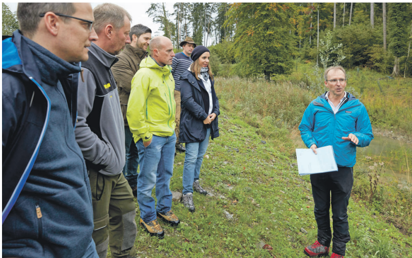
Regierungsrätin Dominique Hasler, ihres Zeichens Kommissionsvorsitzende, beim Jahrestreffen der Landesrürfekommission zum Thema «Hochwasserschutz und Wald».

Instabile Wälder, wie sie im oberen Bereich des Tisnertobels zu finden seien, würden heute zwar noch einen vergleichsweise geringen Teil der Waldfläche ausmachen. Die Sicherung und Förderung stabiler Waldzustände sei aber wesentlich von einer funktionierenden Waldverjüngung abhängig. An mehreren Anschauungsobjekten wurde den Angaben zufolge darauf hingewiesen, dass aufgrund grossflächiger Verjüngungsdefizite diesbezüglich grosser Handlungsbedarf besteht.